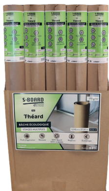
Box de 25 rouleaux

Box présentoir : pour 25 unités réf. 1997SB