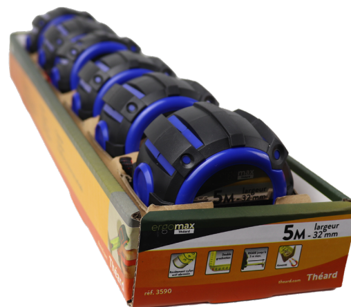
présentoir de 6 unités réf. 3590

réf. 3590 : en présentoir de 6 unités sans blister réf. 3591 : en présentoir de 6 unités sans blister