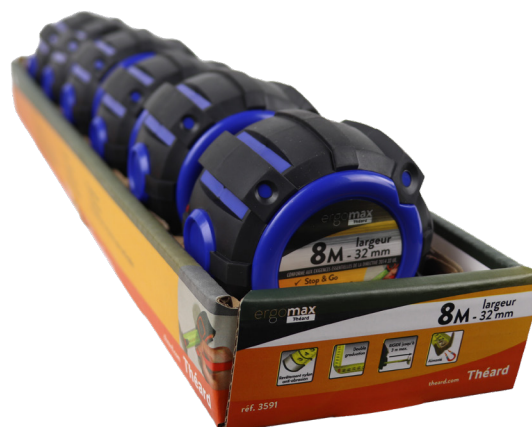
présentoir de 6 unités réf. 3591