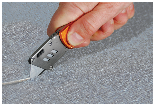
Mise en situation