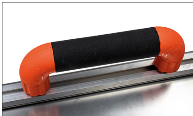
Poignée longue ronde bi-matière disponible en 120, 240, 360 mm