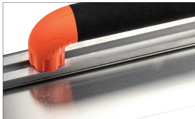
Une poignée ergonomique en mousse ultra compacte réglable fixée sur un rail déportée pour une meilleure visualisation du travail en cours.